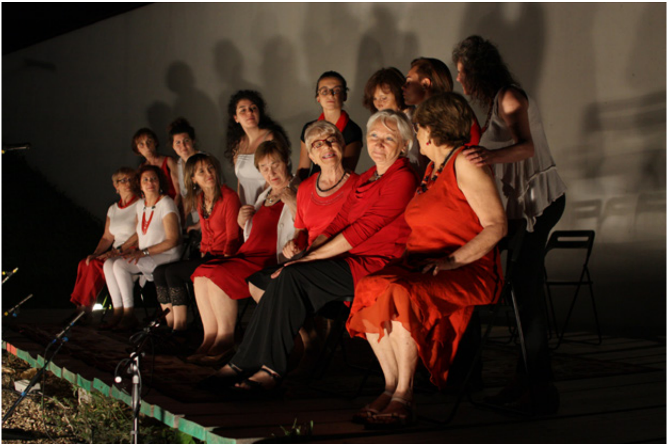
sopra. La Festa dei Vicini 2014 sotto. Il corpo che cambia – Salute,donne! Spettacolo Teatrale con le donne dei laboratori di Settimo Torinese e Pinerolo. A cura di G.Bordin, M.Fabbris, R. Rabezzana, E.Ruzza. [teatro]