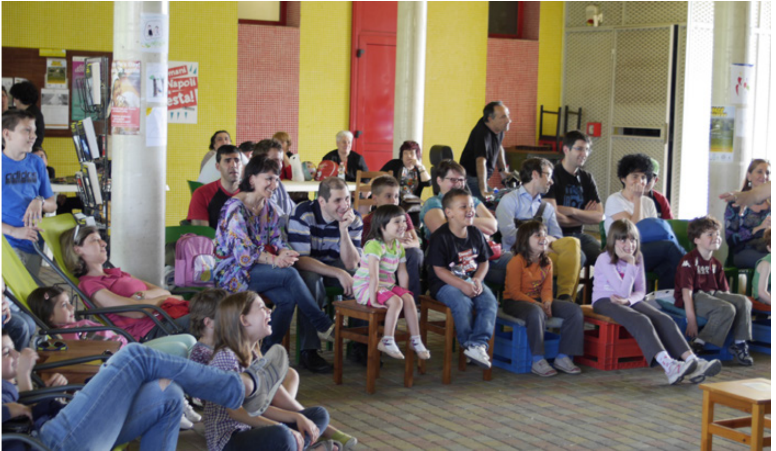
La rassegna "Il sabato dei bambini" aprile-maggio 2014