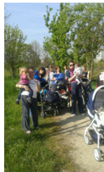
Camminate nel parco per mamme e bambini a cura di Mami