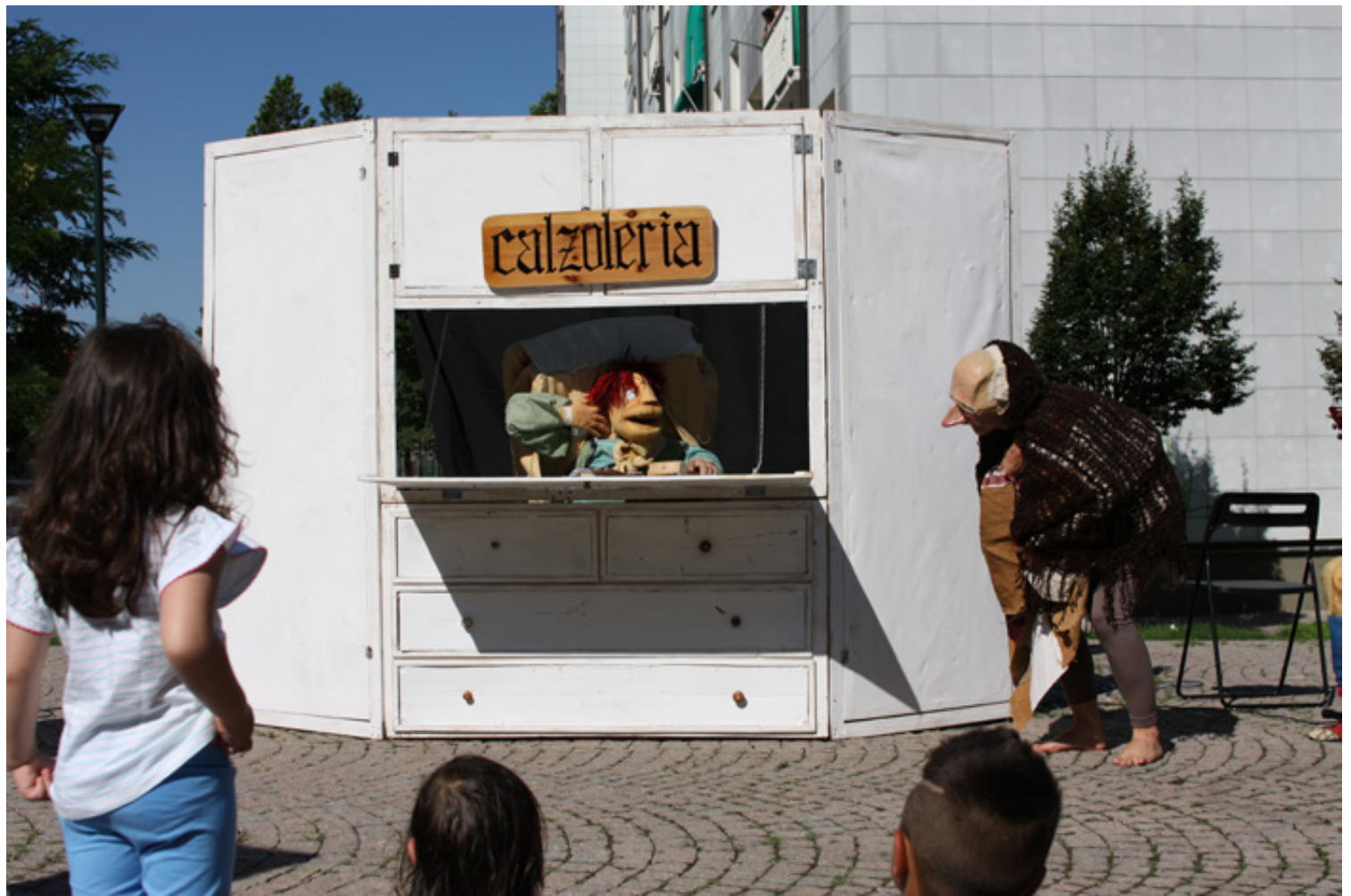
Sabato dei bambini nel cortile con anfiteatro di via Artom 63