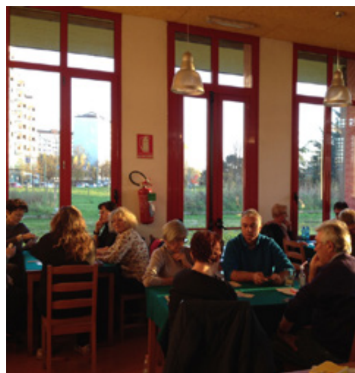
Gioco del Burraco alla Locanda nel Parco. Tutti i giovedì da ottobre 2014

della Fondazione Mirafiori. L'intervento, resosi necessario per arginare una situazione di emergenza, è stato limitato nel tempo perché si ritiene più utile lavorare (in una prospettiva di medio lungo periodo) per un presidio "naturale" della Casa attraverso la costruzione di attività universali, rivolte a tutti i ragazzi (non solo a quelli con un disagio) e a diversi target della popolazione (famiglie, anziani, mamme...). A partire dall'autunno 2014 dunque si è cercato di attivare di rapporti con associazioni in grado di rispondere alle esigenze del territorio e con un buon potenziale di attrazione, evitando interventi specifici su target limitati. Contestualmente all'intervento di Uisp la Fondazione Mirafiori ha attivato dei contatti con le Forze dell'ordine del territorio per aumentare il presidio sulla struttura. È stato realizzato a fine anno un incontro con la Circoscrizione 10, la Polizia municipale, la Polizia di Stato, i Carabinieri in cui si è parlato della situazione della Casa nel Parco e sono stati concordati dei passaggi più frequenti delle pattuglie. Inoltre è stato avviato un contatto con il Nucleo di prossimità della Polizia Municipale volto a intervenire con modalità anche di mediazione e contenimento sugli atteggiamenti devianti da parte degli adolescenti.