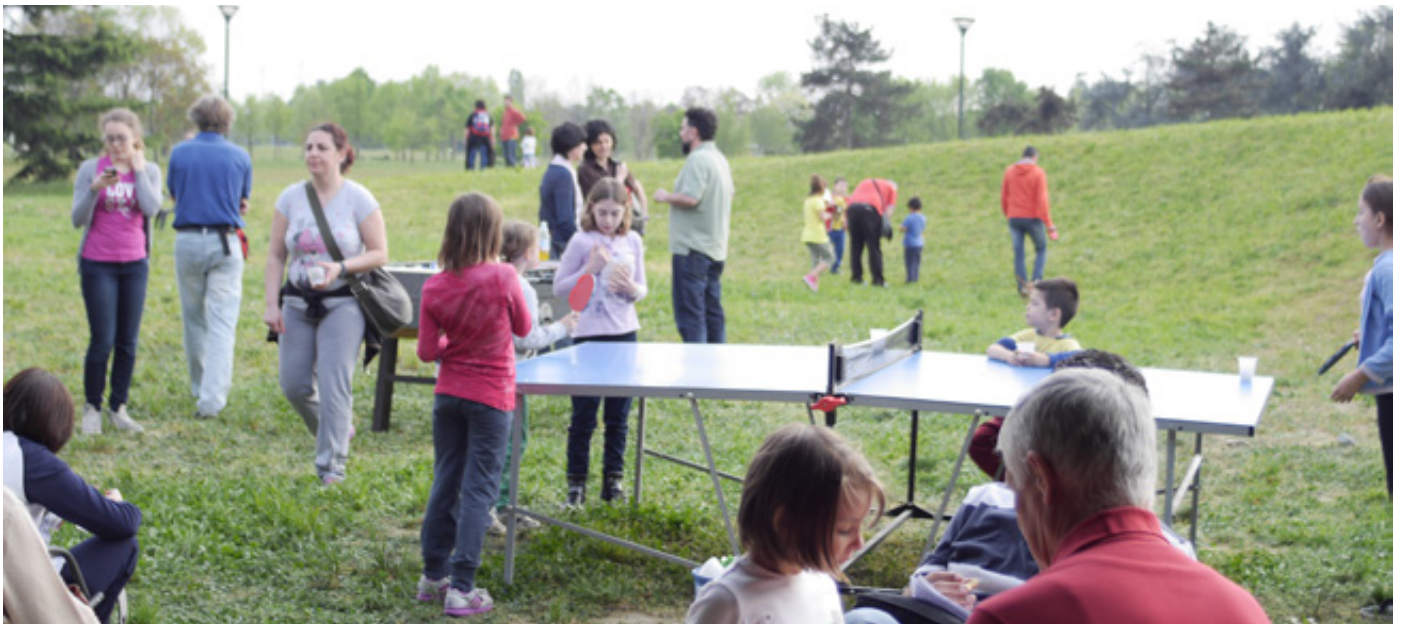
aprile 2014. un sabato pomeriggio alla Casa nel Parco