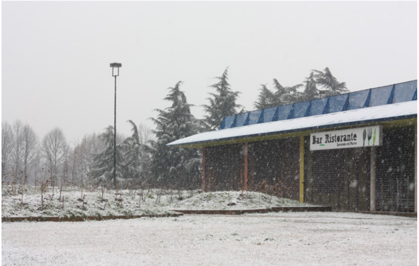
La Locanda nel Parco. sopra: gennaio 2014; sotto: giugno 2014