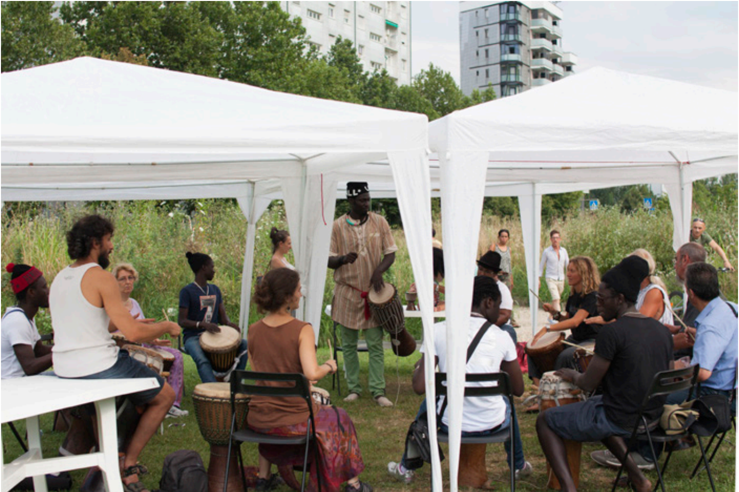
Laboratorio di percussioni durante il Tribal Town.