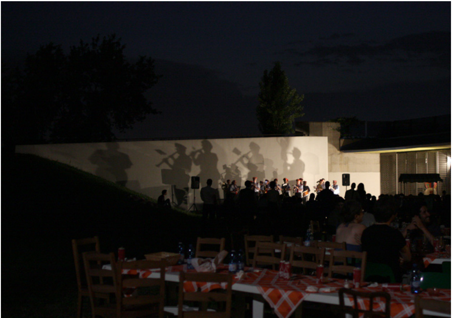
CineCommedy a Mirafiori. Rassegna cinematografica dedicata alla commedia europea sotto le stelle (giugno e luglio 2014 tutti i giovedì)