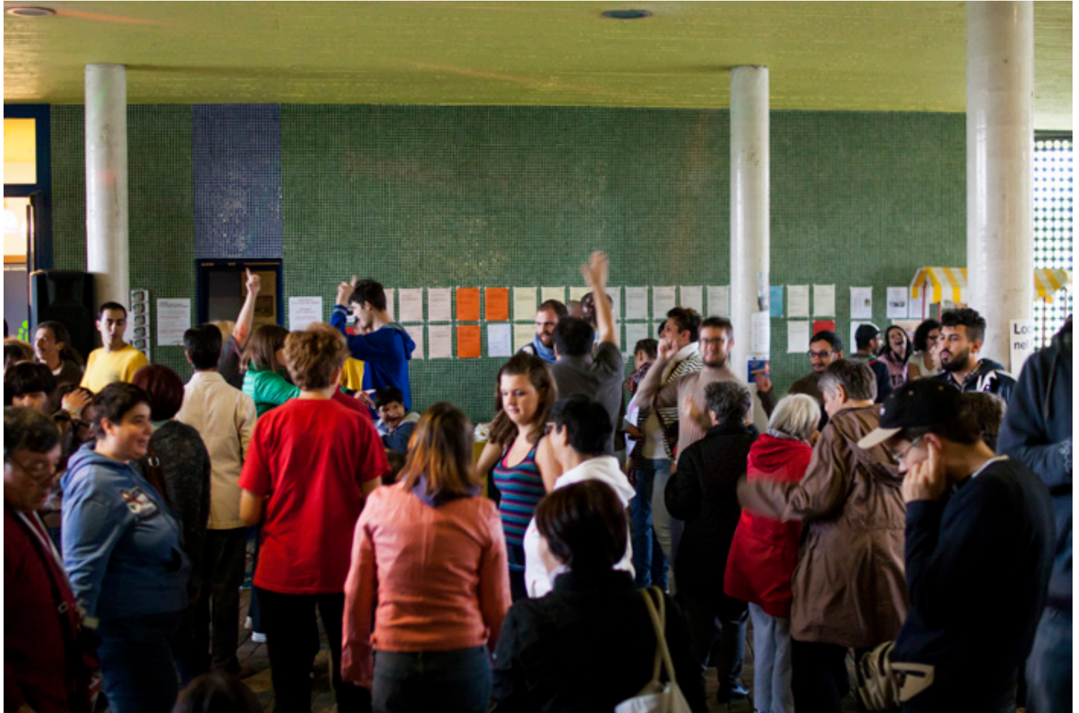
sopra. Disco Party. A cura di Coop. Arcobaleno. Appuntamento del martedì pomeriggio settembre 2014 sotto. BarCamp – Convegno Bikenomics. settembre 2014