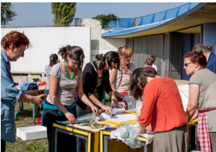
Laboratorio di Autocostruzione - produzione del feltro a cura della Rete Solare