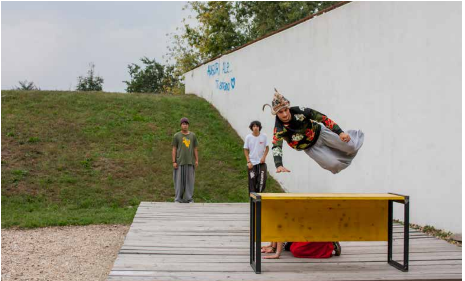
sotto: evento ParKour, rassegna estiva 2015