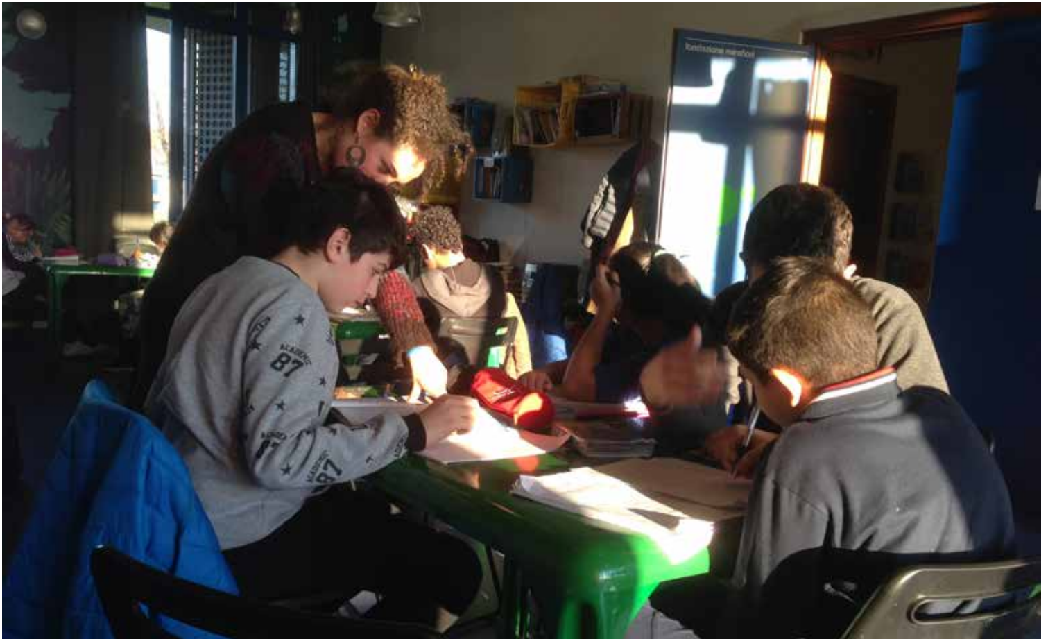
sopra: doposcuola ASAI (scuole medie inferiori), martedì e venerdì