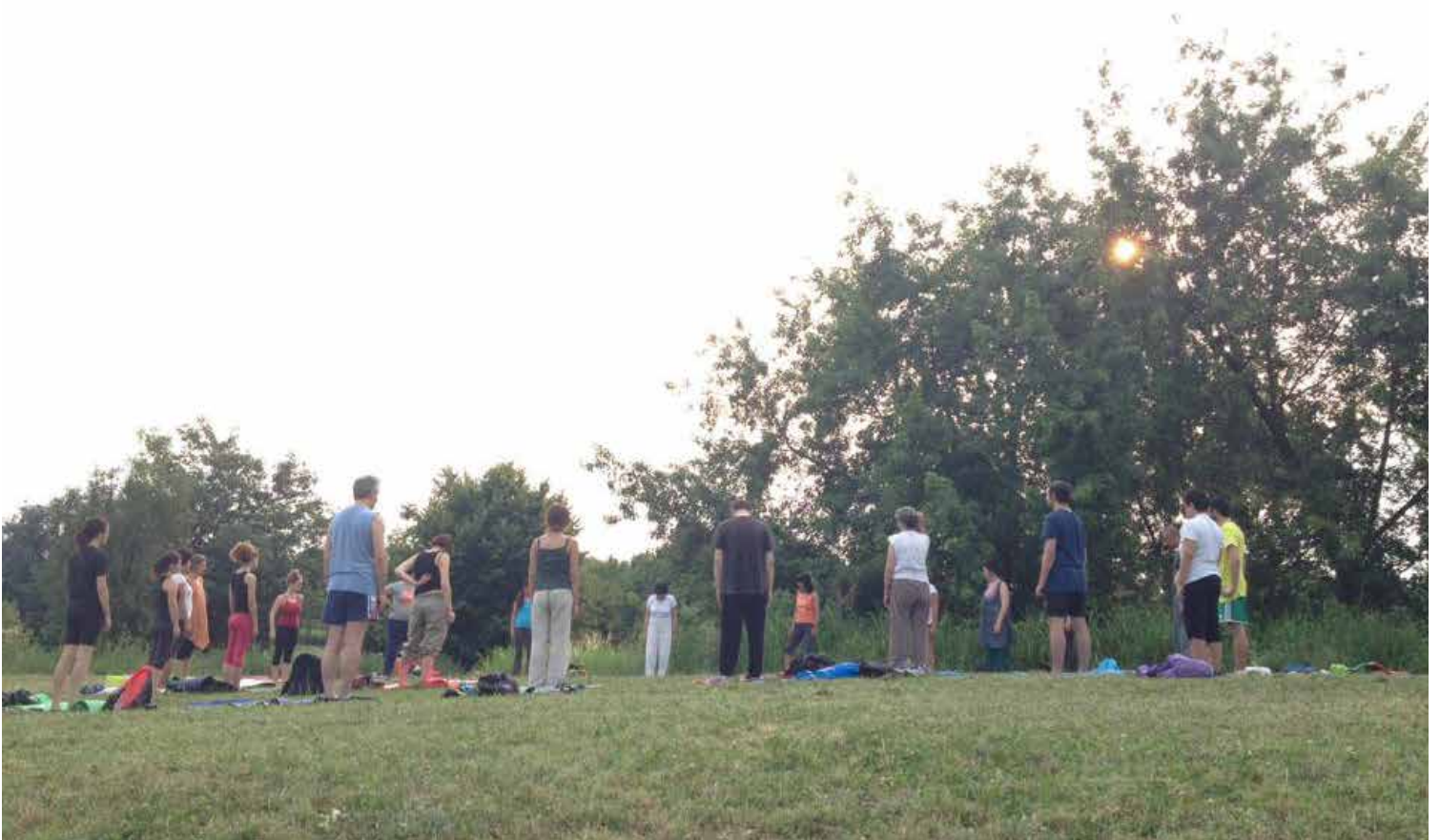
sotto: meditazioni camminate, estate 2015