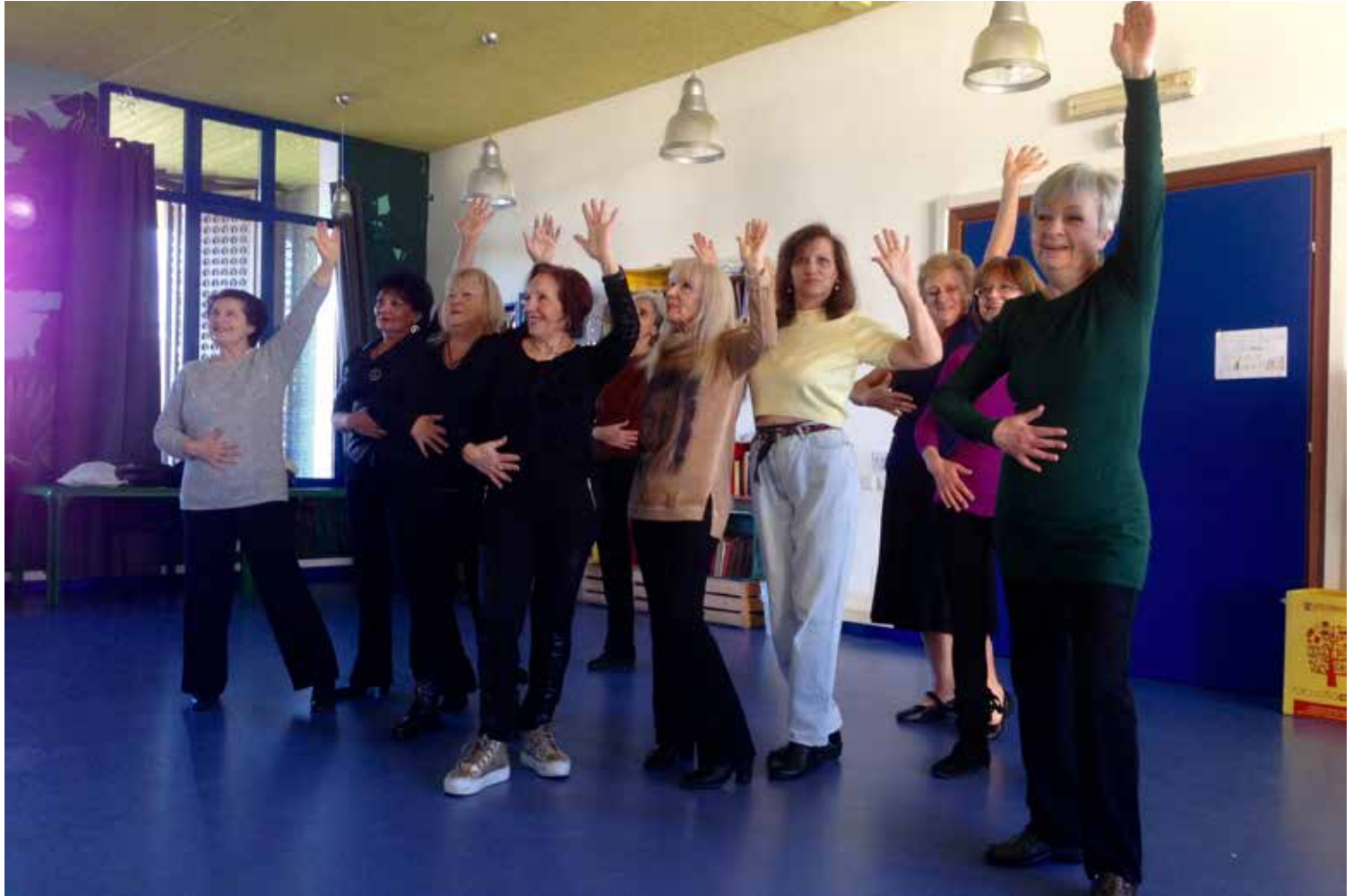
sopra: mattinate danzanti, giovedì mattina, da ottobre;