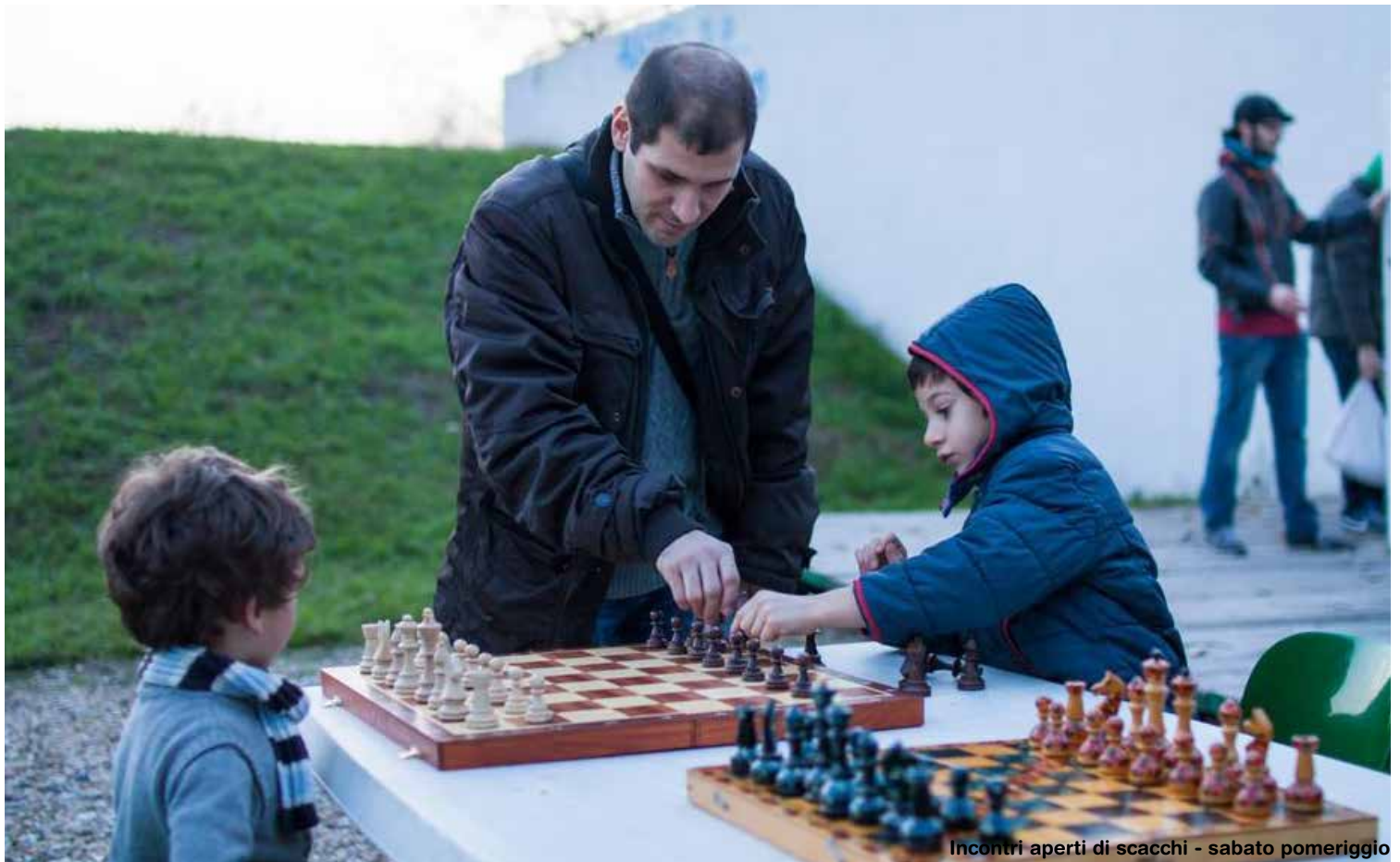
Incontri aperti di scacchi - sabato pomeriggio