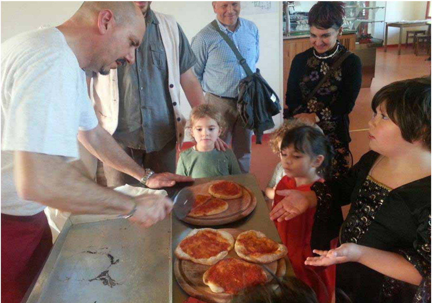
Laboratorio di Pizza alla Locanda, Halloween