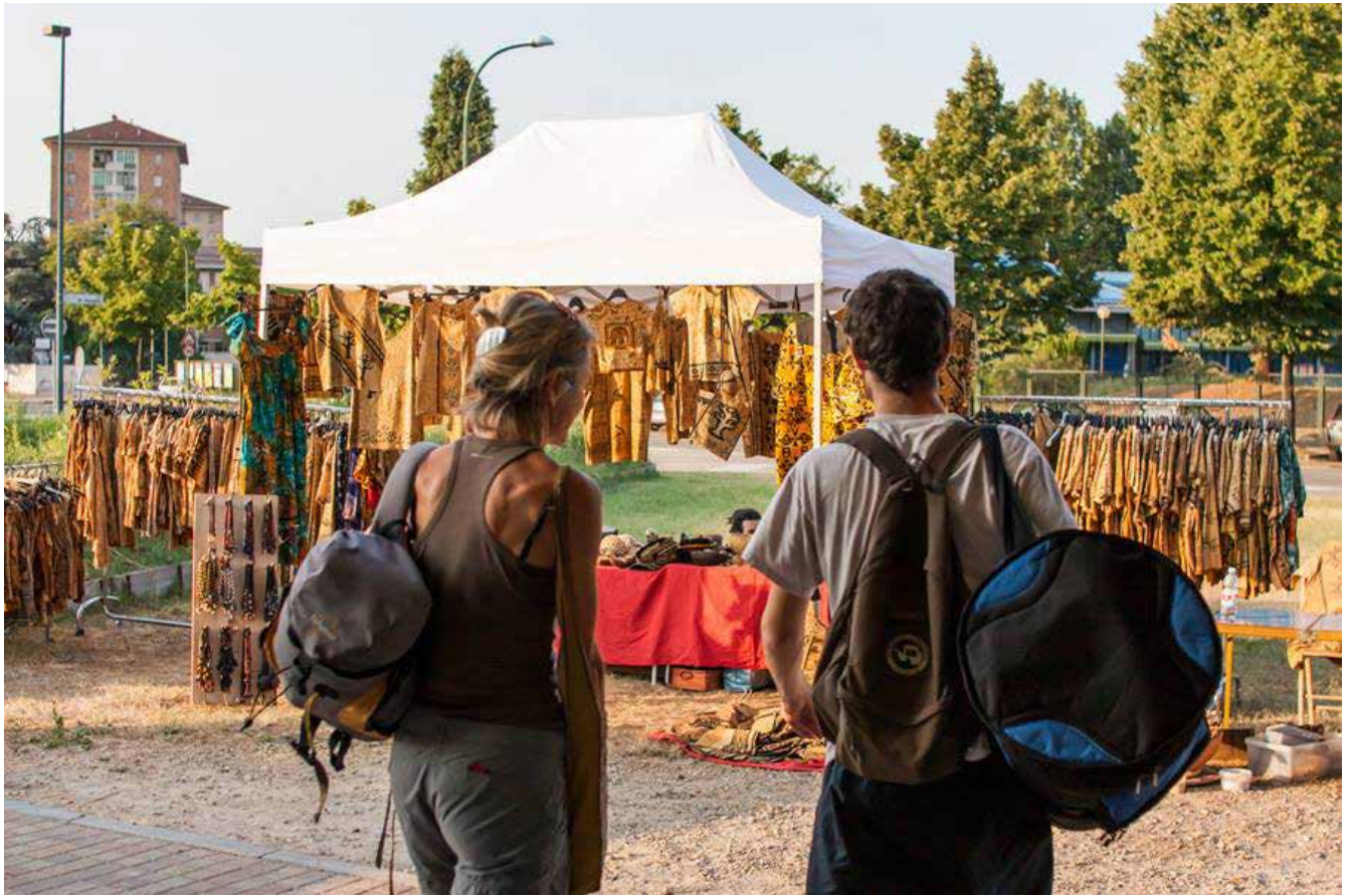
sopra: Rassegna Estiva: Tribal Town - luglio 2015 sotto: Rassegna Estiva: I 4 del Trio - luglio 2015