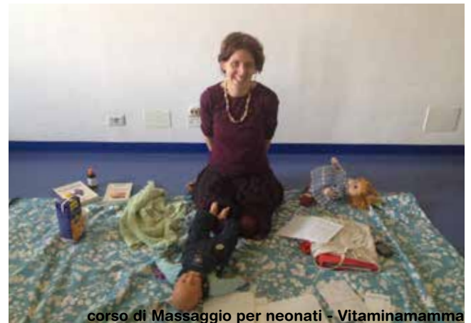
corso di Massaggio per neonati - Vitaminamamma