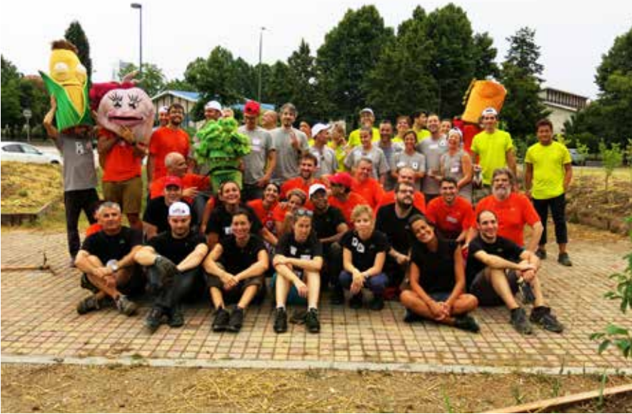
FCA riconfigura il giardino della Casa nel Parco Team Building Sociale per Mirafiori