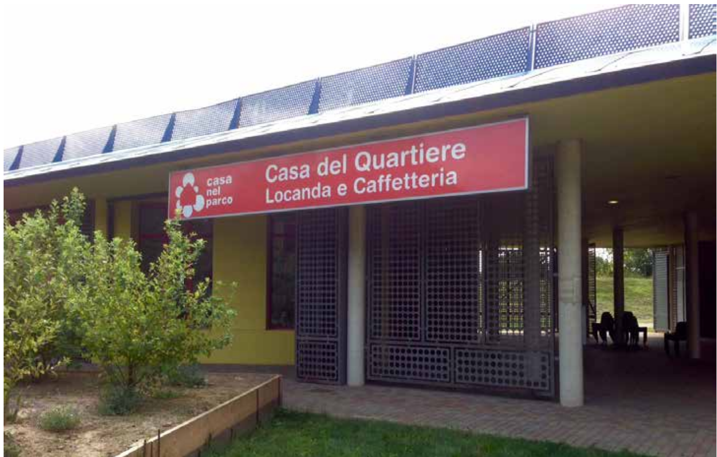
sopra: la nuova insegna, settembre 2015; sotto: la lavagna delle attività di novembre 2015