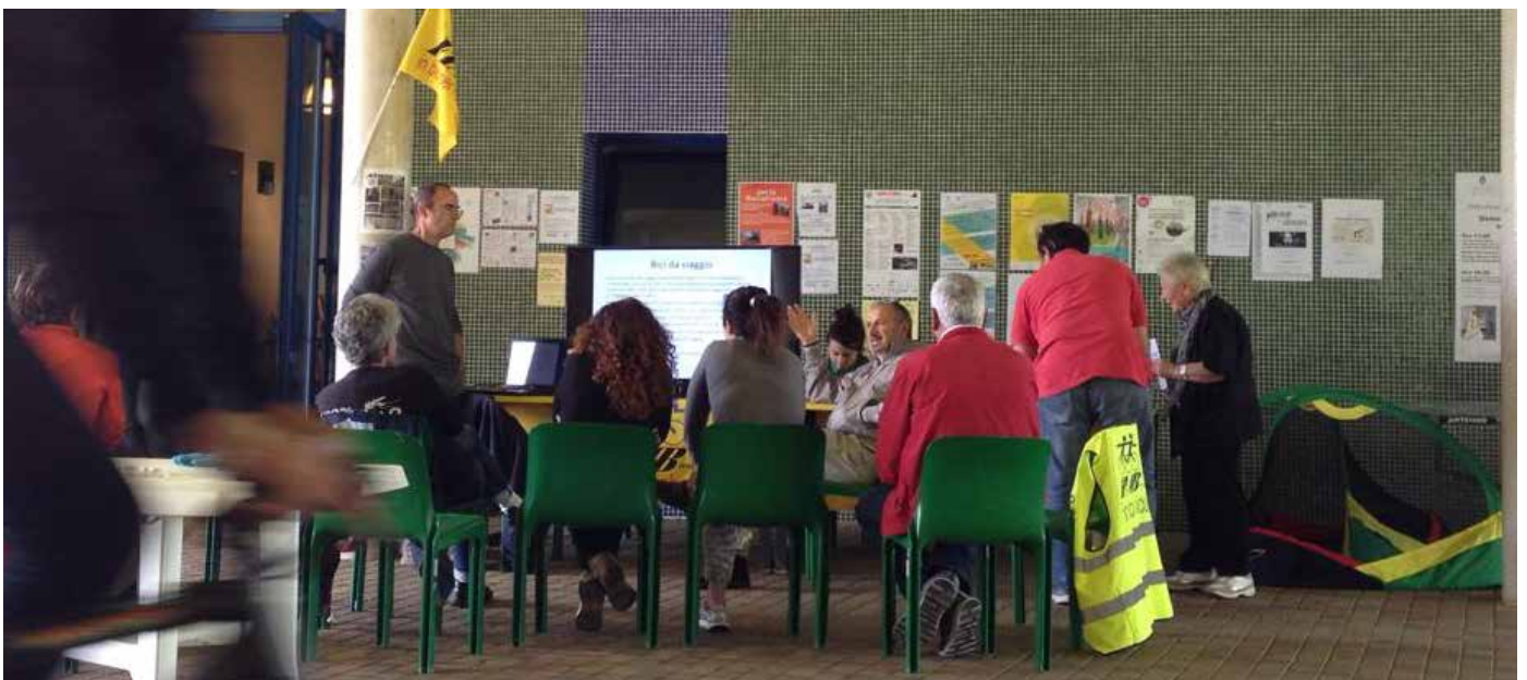
bici &amp; dintorni, sabato pomeriggio giugno-settembre 2015