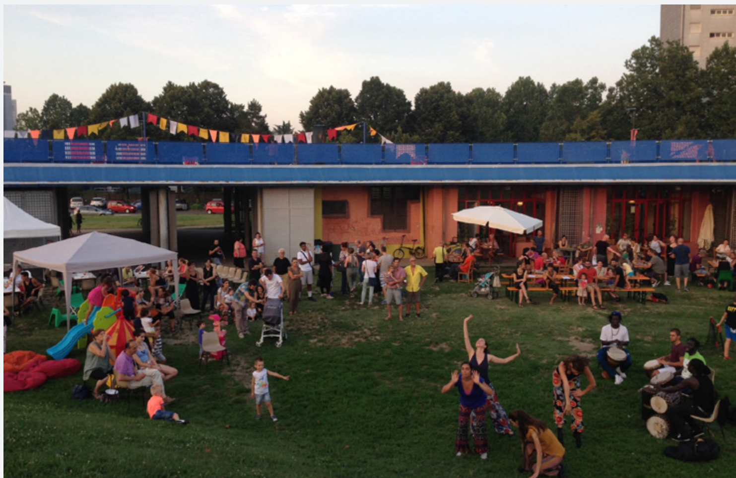
La festa della Ludoteca estiva