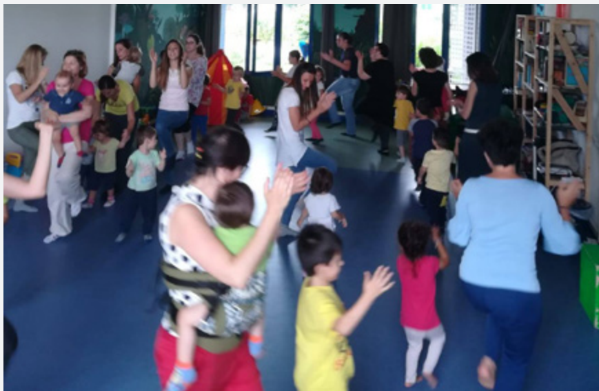
settembre 2018: presentazione programma attività 2018-2019