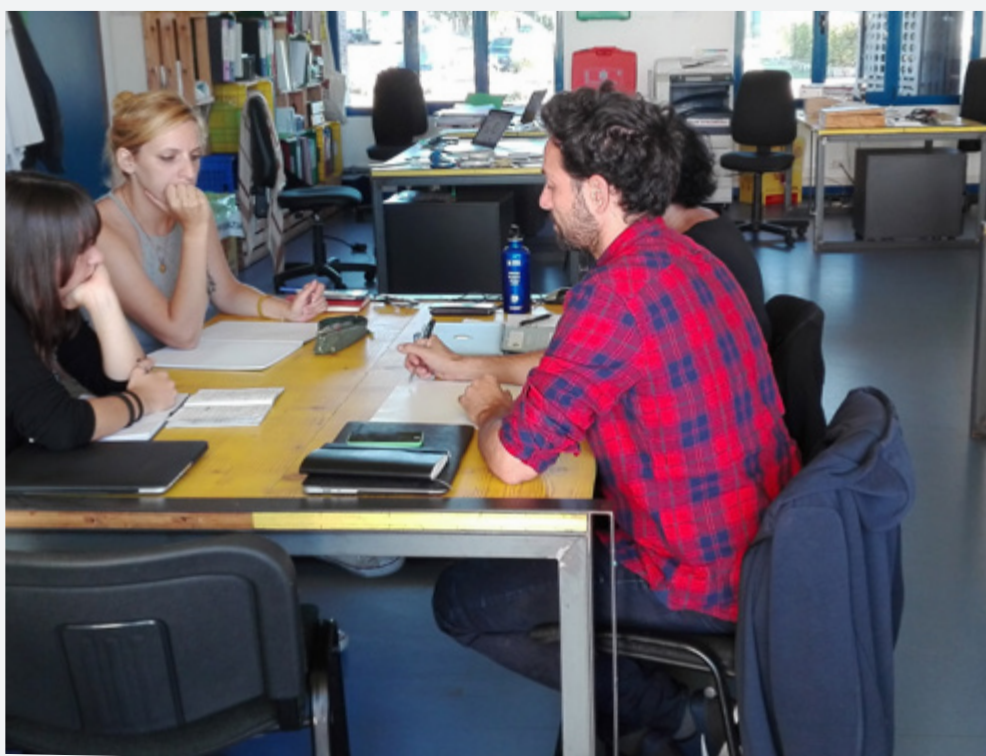
sotto: lo spazio di co-working alla Casa nel Parco

giardinaggio e piccole manutenzioni. Ai volontari ingaggiati gli anni scorsi con il progetto Senior Civico se ne sono aggiunti altri 4 tramite il portale Celo Celo, gli altri sono entrati in contatto con la Casa nel Parco tramite reti di prossimità. E' proseguito il coinvolgimento di volontari tramite il progetto "Mirafiori insieme": circa 8 volontari anziani hanno offerto alcune ore per piccole manutenzioni della struttura, attività di giardinaggio e supporto agli eventi nei mesi invernali. Va ricordato che negli ultimi mesi del 2018 si è lavorato in modo mirato per aumentare la partecipazione dei volontari per i progetti di Fa bene e Carota ma in linea generale anche per rafforzare il presidio di accoglienza della Casa. Nei primi mesi del 2019 sono stati realizzati 3 incontri pubblici in seguito ai quali verranno realizzati percorsi di formazione e l'inserimento dei volontari in gruppi di lavoro tematici.