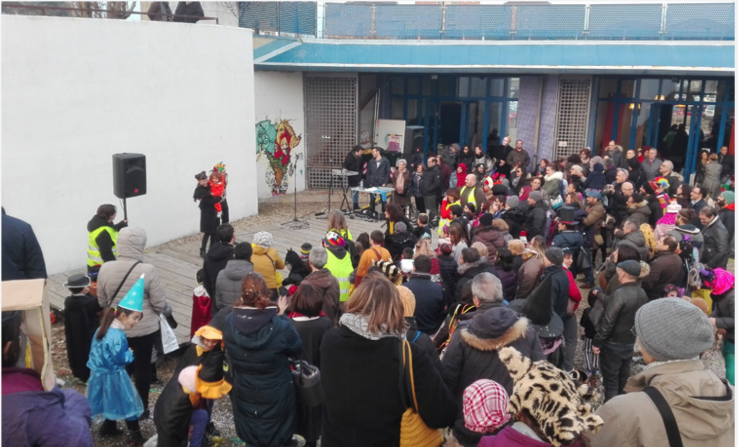
sopra: Carnevale 2018 sotto: laboratori didattici a cura di Parco del Nobile