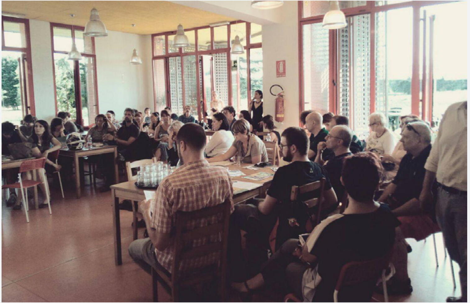
sopra: CO-CITY Incontro aperto Nella pagina accanto: a sinistra PIANTlamo a destra Piazza Ragazzabile riconoscimento del lavoro dei ragazzi durante una serata di Cinecommedy