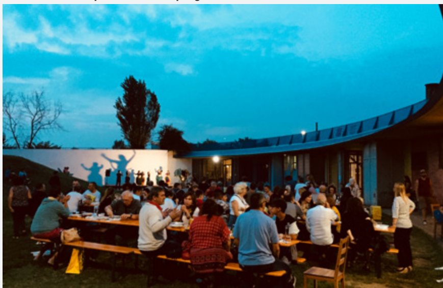
settembre 2018: Locanda in occasione di Scarti d'eccellenza, Slow Food Mirafiori h24