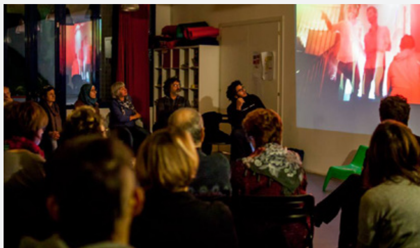
Inaugurazione Panchina Rossa