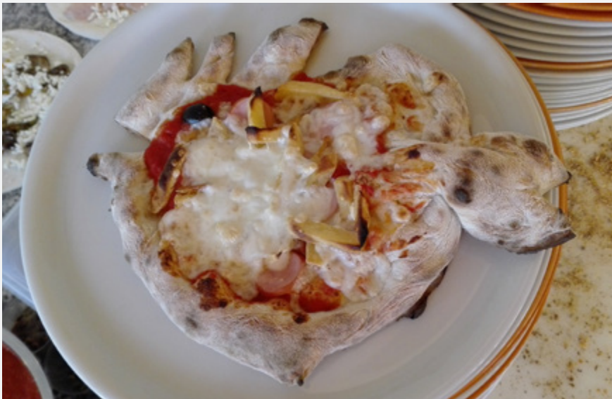
La pizza bimbo di Aldo