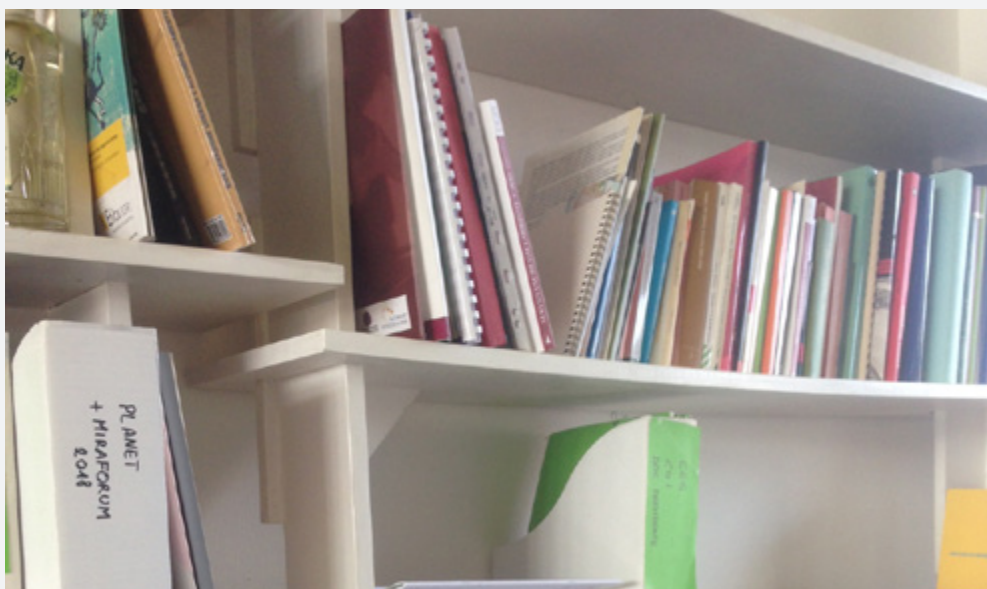
sopra: Interventi di manutenzione straordinaria della Casa nel Parco Le nuove librerie donate da Fieri