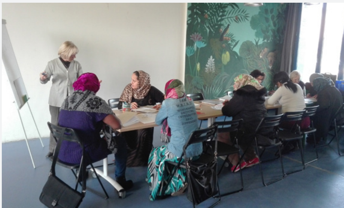
sopra: Scuola delle Donne

Presso la Casa nel Parco sono stati realizzati alcuni incontri e cabine di regia del progetto "Silver Point" un centro di servizi rivolto alle famiglie ed in particolare agli anziani fragili, realizzato dalla Coop. Solidarietà sul territorio di Mirafiori sud con il sostegno della Compagnia di San Paolo. Va infine ricordato che è proseguita la collaborazione con il progetto Celocelo , un progetto sostenuto da Compagnia di San Paolo, che prevede un sistema di reperimento e distribuzione di beni di prossimità di varia natura, basato su una rete locale di enti no profit e su una piattaforma informatica che rende possibile l'incrocio della domanda/offerta di beni e servizi di prima necessità. Alcuni degli utenti in situazione di difficoltà economica hanno beneficiato delle opportunità offerte dal progetto e viceversa è stata promossa l'iniziativa tra i cittadini del quartiere.