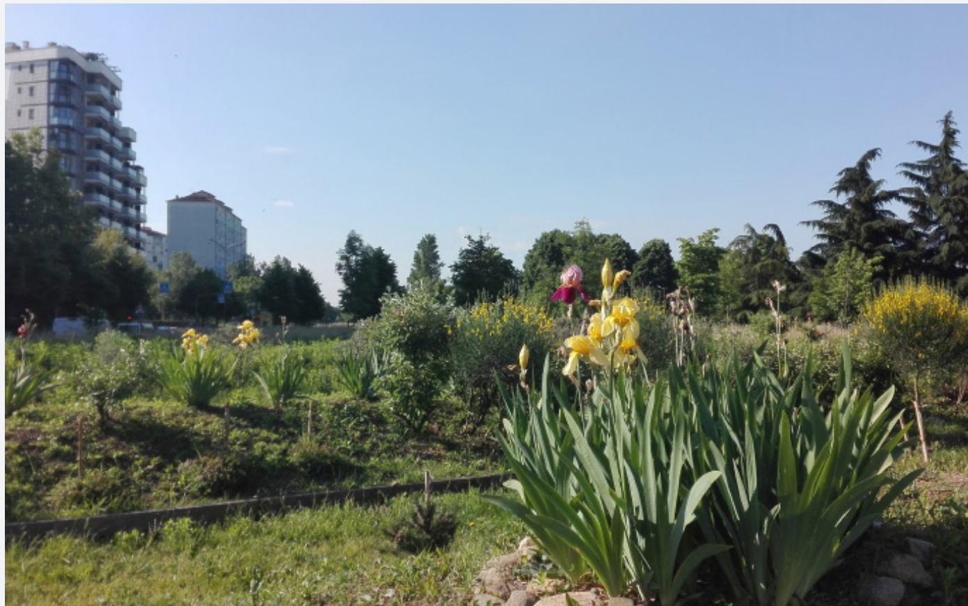
sopra: la fioritura del giardino sotto: gli amici della Casa nel Parco